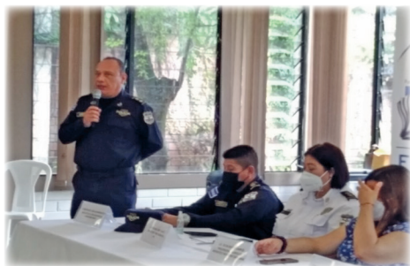
► Clausura de Jornada de Capacitación de Ciudad Delgado.

De igual manera, la implementación de la Mesa de Diálogo ha permitido desarrollar aún más, las competencias de ambas entidades, a partir de la realización de reuniones con acuerdos bilaterales y la participación de otras instituciones vinculadas a la solución de los problemas específicos, entre las que se puede mencionar: Fiscalía General de República (FGR), Procuraduría General de la República (PGR), Corte Suprema de Justicia (CSJ), Ministerio de Seguridad Pública y Justicia (MJSP), Dirección General de Centros Penales (DGCP), Ministerio de Salud (MINSAL), entre otros.