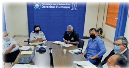
► Reunión de Mesa Central en sede de PDDH. Participan Unidades adscritas a la Secretaría de Responsabilidad Profesional y equipo de la PADMSC.

inminente riesgo de vulneración el derecho a la vida, integridad y libertad personal de la población, en el marco de los procedimientos policiales.