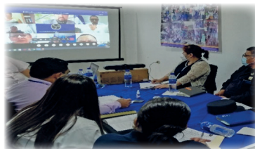
Realización de reunión virtual con Jueces de Vigilancia Penitenciaria en la Delegación Departamental de La Paz.