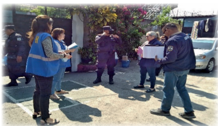
Verificación de las condiciones en local de la Fuerza Operativa Conjunta Antidelincuencial, conocido como Grupo Foca en San Jacinto.