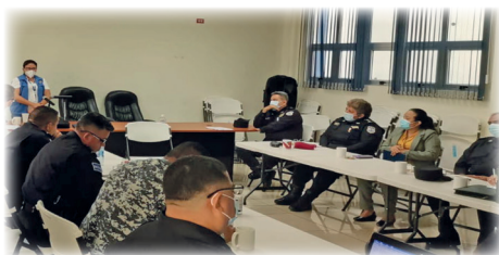
► Reunión Mesa de Diálogo Departamental de La Paz.