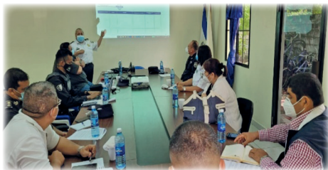
► Reunión regional de trabajo, realizada en la Delegación policial de Usulután.

Las reuniones se realizan una vez al mes, alternando entre ambas instituciones el papel de anfitrión, es decir una vez se hace en las instalaciones de la PDDH y otra en la de la Secretaría de Responsabilidad Profesional, debiéndose elaborar una agenda y tomar nota de los acuerdos adoptados para facilitar su cumplimiento.