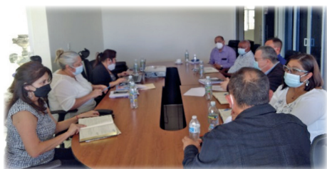
Reunión mensual de Mesa Central.