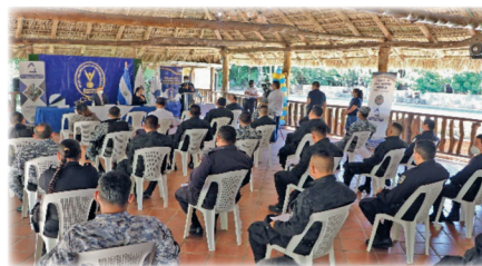
► Jornada de Capacitación por parte de PDDH para elementos policiales de la Delegación de Cabañas