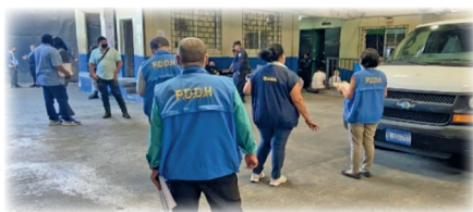
Verificación de personas privadas de libertad en la Unidad de Servicios Extraordinarios de la Delegación de la PNC de San Salvador, conocida como el Penalito de La Naval.