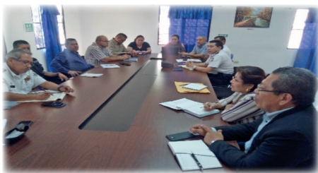
► Reunión de Instalación de Mesa Departamental de Usulután.

Desde esa fecha se ha venido trabajando en las diferentes mesas, con el objetivo de orientar el trabajo articulado de ambas instituciones, contando con un organismo principal denominado « Mesa Central ».