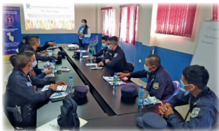
► Jornada de capacitación en el Departamento de San Miguel.