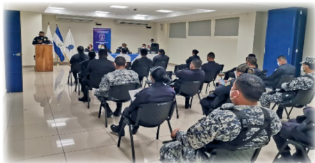
Jornada de Capacitación para agentes policiales de La Paz